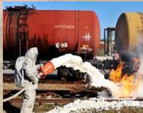
Основи цивільного захисту